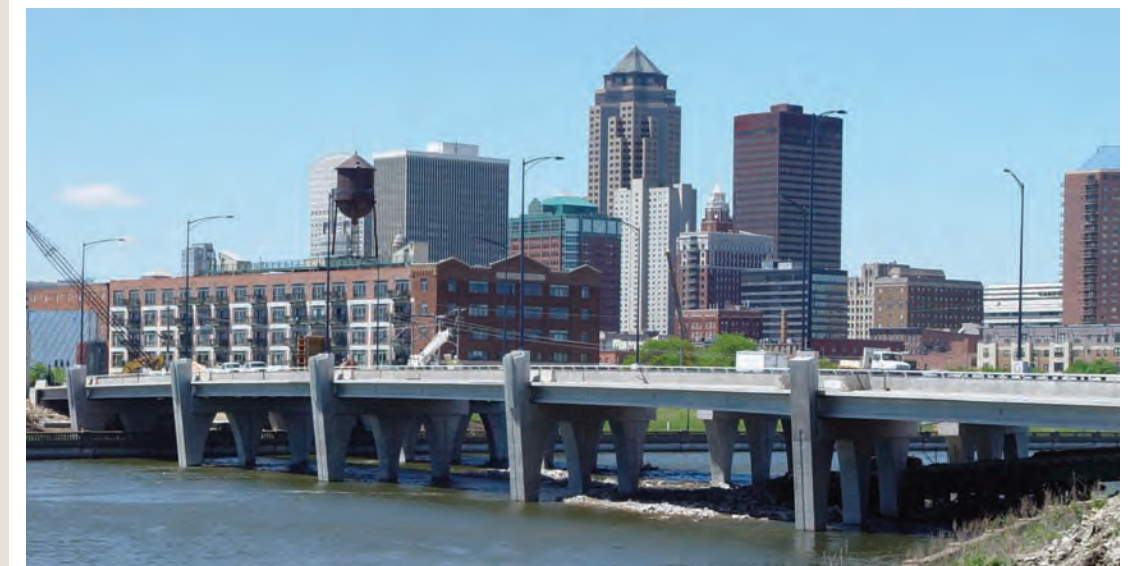
La construcción de los puentes del SE Connector se acerca a su término